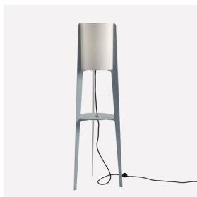
FLOOR LAMP LÁMPARA DE PIE